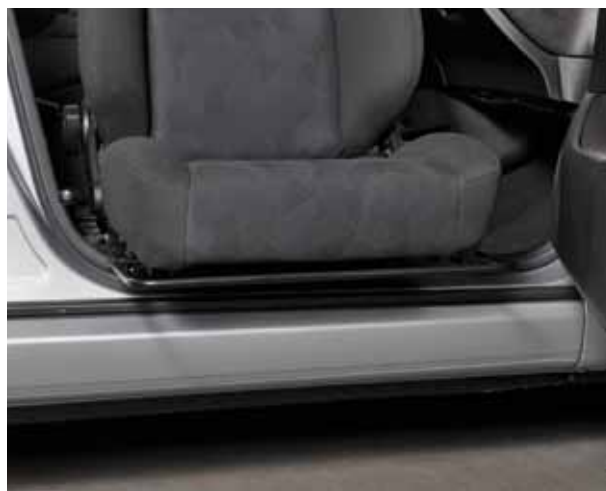
Der Drehsitz lässt sich seitwärts schwenken und ausfahren.

Der Sitz kann auf Wunsch mit einer elektrischen oder mechanischen Vorschub-Einrichtung ausgerüstet werden.