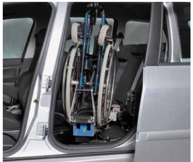
Sauber eingeladen: Der Rollstuhl wird per Kran hinter dem Fahrersitz verstaut.

Dieses Verladesystem hat eine Nutzlast von 25 Kilogramm. Auf Wunsch kann die Anlage für eine höhere Nutzlast angefertigt werden.