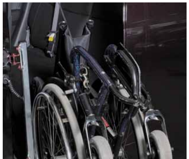
Die Teleskoptür ermöglicht ein müheloses Verladen des Rollstuhls.

Beide Umbausysteme können einzeln eingebaut oder mit anderen Systemen kombiniert werden.